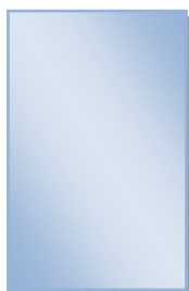
ΣΟΥΖΑΝΑ ΛΑΣΚΑΡΙΔΟΥ, αναπληρωματικό μέλος

Μιλάει αγγλικά, γαλλικά, ιταλικά και ισπανικά.